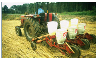
Una sembradora de tres hileras sembrando por un cultivo de cobertura acamado por un rodillo de cuchillas. (T. Friedrich)

La siembra directa involucra a cultivos que crecen sin la preparación mecánica de la cama de siembra o alteración del suelo desde la cosecha del cultivo anterior. El término de siembra directa en el contexto de la Agricultura de Conservación es usado como sinónimo de agricultura de no-labranza o labranza cero. La no-labranza implica cortar o aplastar las malezas y los residuos del cultivo anterior o asperjalos con herbicidas para el control de malezas y sembrar directamente a través de la capa de cobertura. Se retienen todos los residuos de los cultivos y el fertilizante se aplica durante la siembra o al voleo superficialmente.