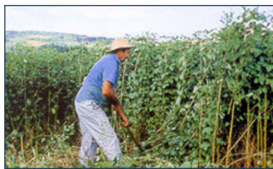
Es necesario manejar los cultivos de cobertura. Esto puede ser logrado manualmente, con animales o con tractores. El punto clave es mantener el suelo siempre cubierto (FAO).