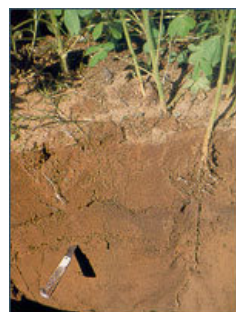
Lámina 1 Las raíces de algunos cultivos de cobertura son capaces de romper el piso de arado o las capas compactadas del suelo. A. Calegari.

Diferentes plantas con distintos sistemas de raíces exploran diferentes profundidades del suelo y tienen la capacidad de absorber distintas cantidades de nutrientes; además, con la producción de varios exudados de las raíces (ácidos orgánicos) son beneficiosas para ambos, el suelo y los organismos.