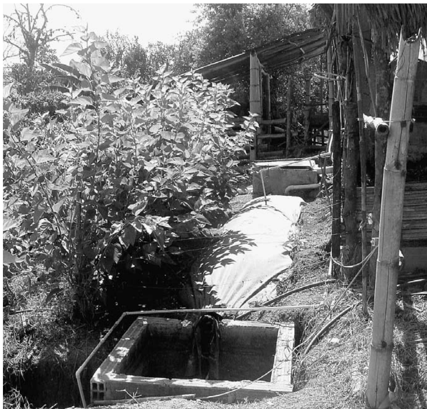
Un biodigesteur fait avec un sac en plastique de 1,2m de diamètre et 6 de long, relié à une porcherie (20 animaux) et protégé par un mûrier.

La relative fragilité du film de polyéthylène est un point faible du système et le mode de fonctionnement est plus ou moins inefficace comparé à celui des digesteurs plus sophistiqués. Toutefois, le coût de construction du digesteur en plastique est très faible, tout