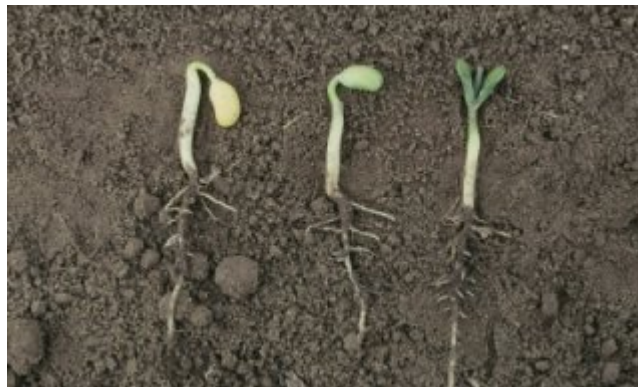
Planche 50. Stades VL et VC de la levée montrant l'élongation de l'hypocotyle et le déploiement des cotylédons.

La germination débute lorsque la graine absorbe l'humidité du sol jusqu'à ce que sa teneur en eau soit d'environ 50 %. La levée de la radicule (racine séminale) est le premier signe externe de germination. Celle-ci pousse vers le bas et s'ancre dans le sol. Peu après, l'hypocotyle (la partie de la tige au-dessus de la radicule) commence à pousser vers le haut en tirant les cotylédons (feuilles séminales) avec lui. On voit à la planche 50, l'élongation de l'hypocotyle et le déploiement des cotylédons des stades VE à VC.